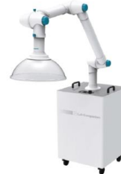
이동형 유해가스 제거장치